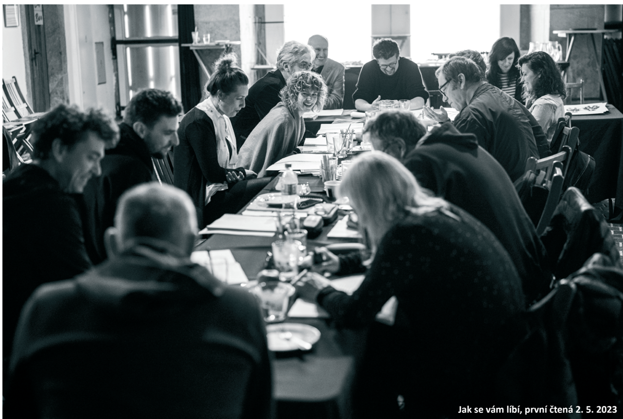
Jak se vám líbí, první čtená 2. 5. 2023

To je nutnost! Žádná velká dovolená se vzhlédem k pracovním povinnostem konat nebude, ale nevádí. Vlastně nic zatím naplánované nemám, ale budu se svou rodinou a my si to umíme udělat hezké všude.